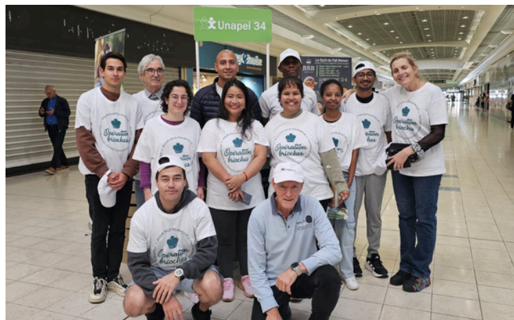
Stand de vente tenu par des étudiants de Montpellier Business School (MBS)