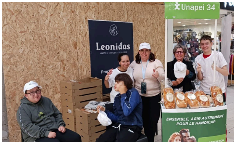
Stand de vente tenu par des jeunes de l'IME Les Pescalunes