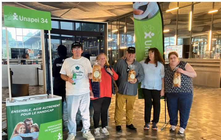
Stand de vente à la mairie de Montpellier

L'Unapei 34 organise chaque année la vente de brioches au profit de ses bénéficiaires et les fonds récoltés permettent ainsi d'améliorer les conditions de vie des enfants et adultes accompagnés en finançant des projets d'inclusion, des infrastructures, en développant des solutions de séjours de répit, en créant des activités sportives et culturelles, de loisirs ou de vacances adaptées. Au cours du mois d'octobre, les associations affiliées au réseau Unapei se sont mobilisées dans toute la France autour de l'Opération Brioches. Dans l'Hérault, la campagne s'est déroulée du 11 au 20 octobre 2024.