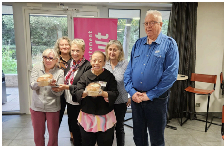
Remise symbolique de la brioche au Département de l'Hérault